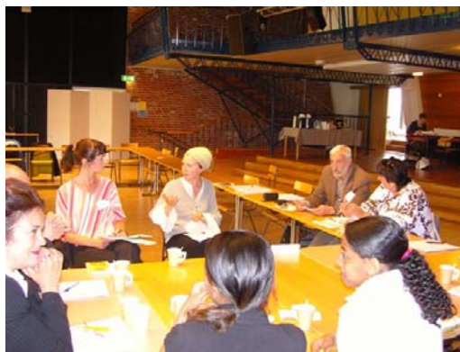
Workshop in Zweden

De eerstvolgende verschijnt in oktober 2009.